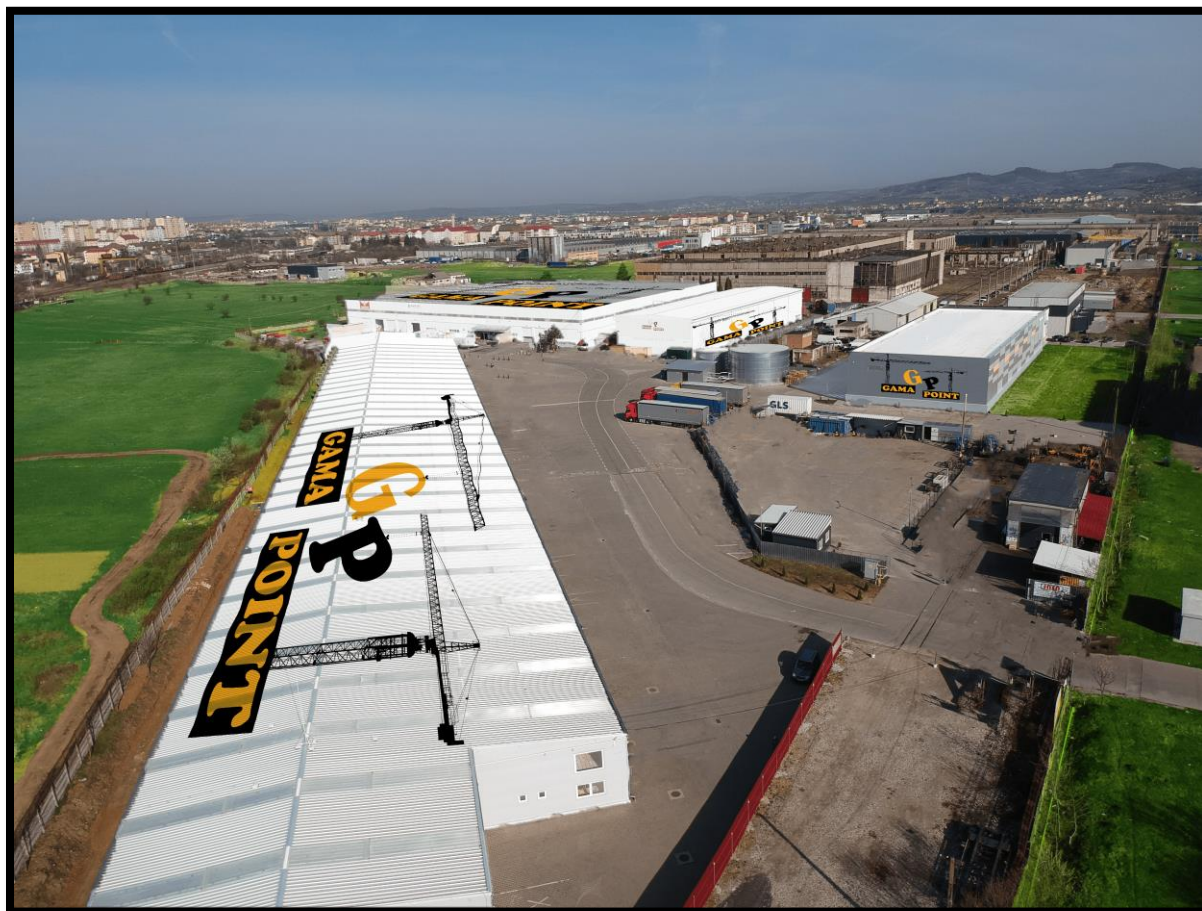
Parc Industrial Central Logistic

Spatiul propus poate fi oferit cu orice alte dotari, fie ca este vorba de compartimentari suplimentare, dotari ale instalatiilor, firma mama este Gama Construct, cu activitate exclusiva in domeniul constructiilor, civile, industriale sau comerciale. Gama Construct este o companie 100% românească, fondată la Sibiu, in urma cu mai bine de 23 de ani. Astfel ca dispunem de toate resursele necesare pentru a oferi spatiile la orice standard, cu orice dotari sunt necesare.